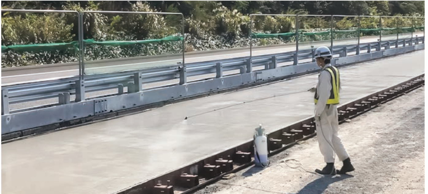
▲コンクリート舗装へのハードコート・クイックの散布状況

コンクリート中のアルカリ成分と結合して硬化し、表面にアルカリ防水層を形成します。コンクリート表面が速く硬化することにより、早期にマット養生が出来るので、ヘアークラックの発生を抑制し、コンクリートの仕上がりを良好します。