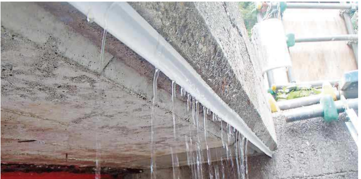
▲構造物底にウォーターカッター設置状況