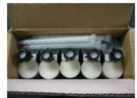
▲1箱梱包状態 スタティックミキサー5本入