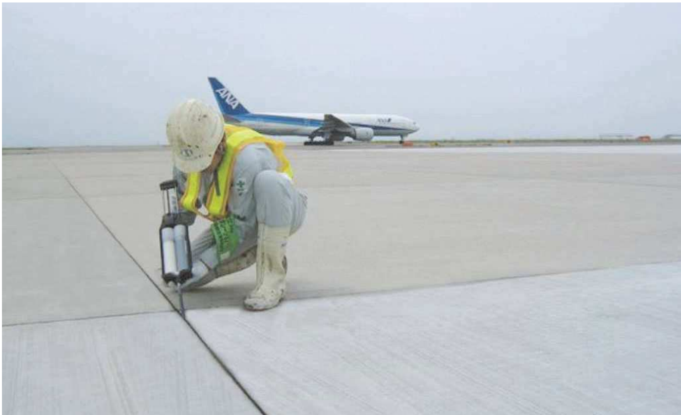
▲中部国際空港エプロン目地注入状況

ポリジェットガングレードはポリジェットの特性を保持し、且つ施工を容易なものとしたカートリッジタイプの製品です。二筒カートリッジとスタティックミキサーにより、従来の二液混合タイプに比べ施工現場での計量や混合といった作業が不要となり、簡単に施工する事を可能としました。少量の施工時も先端のスタティックミキサーを交換する事で、容器内の残量を再び使う事が出来ますので経済的です。