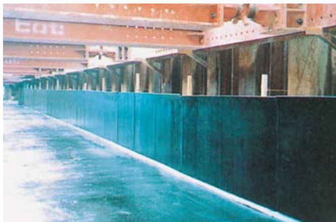
▲地下構造物に使用

※AOIエラストイトは、厳重な品質管理と独特な原料配合で機械的に大量生産されたアスファルトマスチック板です。高い品質と生産力によって全国の需要をまかない、広い販売網をもっています。