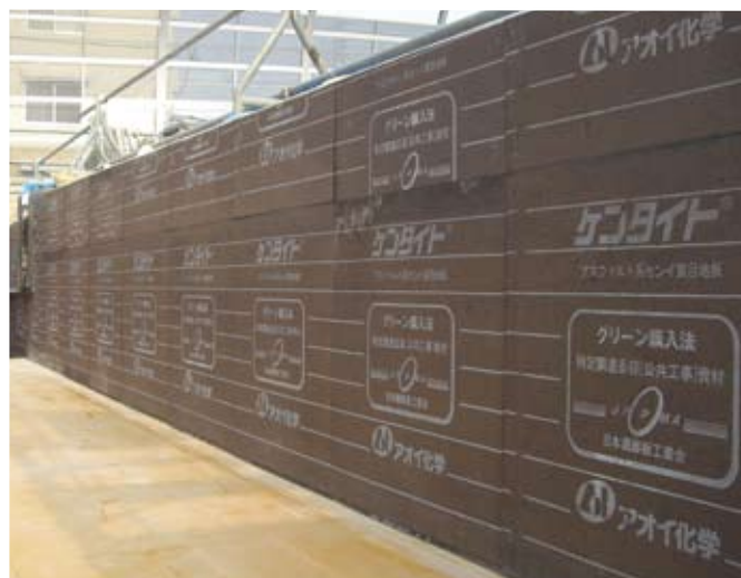
▲浄化センターの目地に使用

ケンタイトは、米国ASTM D-1751、NEXCO3社規格(平成20年8月版)の全項目に合格し、優秀な性能を有しています。