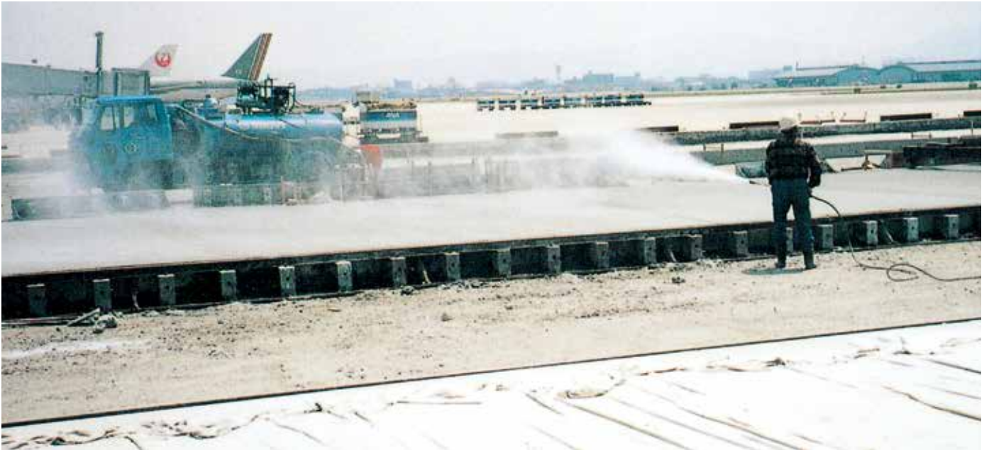
▲駐機場拡幅コンクリート舗装へのハードコート・クイックの散布状況

コンクリート中のアルカリ成分と結合して硬化し、表面にアルカリ防水層を形成します。コンクリート表面が速く硬化することにより、早期にマット養生が出来るので、ヘアークラックの発生を抑制し、コンクリートの仕上がりを良化します。