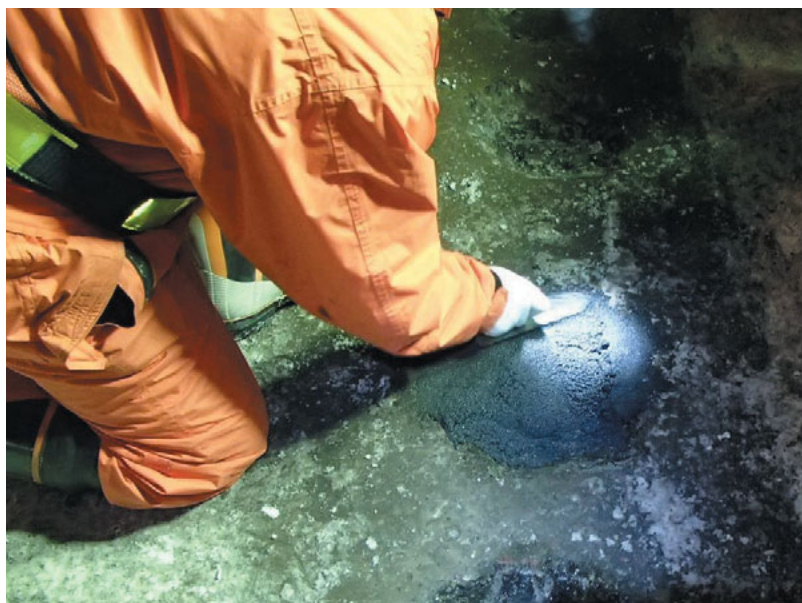
▲アスファルト舗装のポットホール補修状況