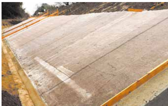
▲護岸工事にキュアマットT-10を使用