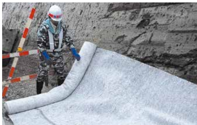
▲護岸工事にキュアマットT-10を使用