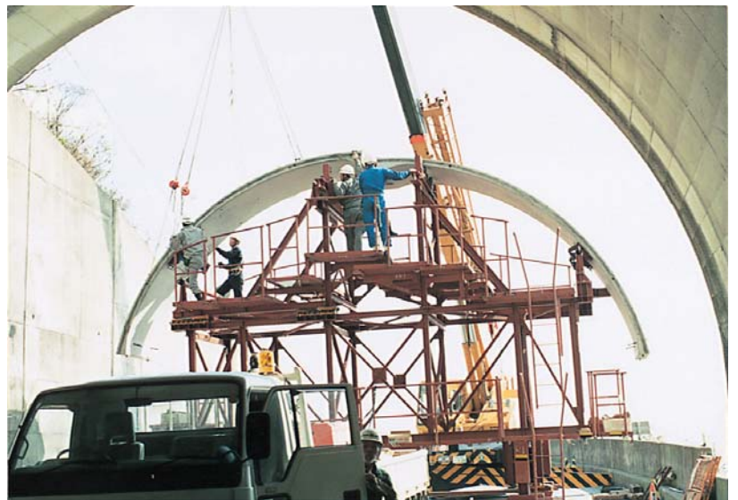
▲トンネルPCL工法にボンドパットを使用