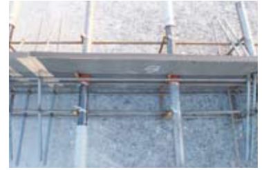
▲舗装膨張目地に使用