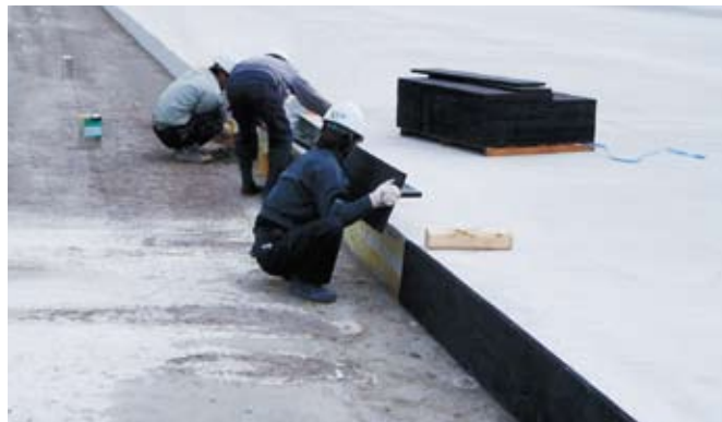
▲空港舗装の目地に使用