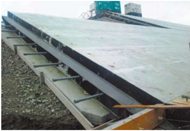
▲防潮堤の目地に使用