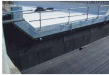
▲空港構造物の緩衝材に使用